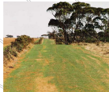
Tosaíonn athghabháil na talún go luath tar éis shuiteáil na gcáblaí, fágtar an talamh glan agus saor ó phiolóin.