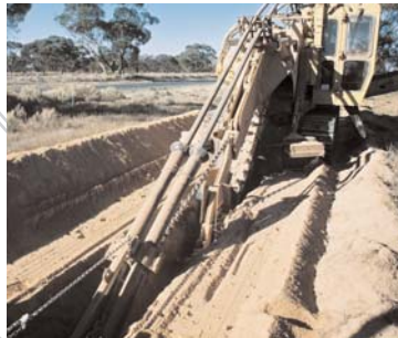
Gearrann meaisín speisialta na bealaigh le han-bheagán suaitheadh.