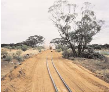
Na cáblaí roimh shuiteáil faoi thalamh.

Tá ardú mór tagtha ar úsáid tarchur faoi thalamh ar fud an domhain. Faoi láthair tá thart ar 5,500 ciliméadar de cábla ardvóltais faoi thalamh san Eoraip. Le deich bliana anuas tá ardú 73.1% tagtha ar shuiteáil línte tarchuir faoi thalamh. Tá 19.43% dá gcuid línte tarchuir suiteáilte faoi thalamh anois ag an Danmhairg, mar shampla. Caithear 25% de línte ardeannaís a chur faoi thalamh sa Fhrainc anois. Fiú in Éirinn taispeáineann staitisticí ó EirGrid go bhfuil 5.01% dá línte féin faoi thalamh. Níos tábhachtaí ná sin, d'fhógair EirGrid cheana féin go bhfuil n i gceist acu cábla 30 ciliméadar a shuiteáil faoi thalamh ón Ros i gContae Bhaile Átha Cliath, go Baile an Bhóthair i gContae na Mí.